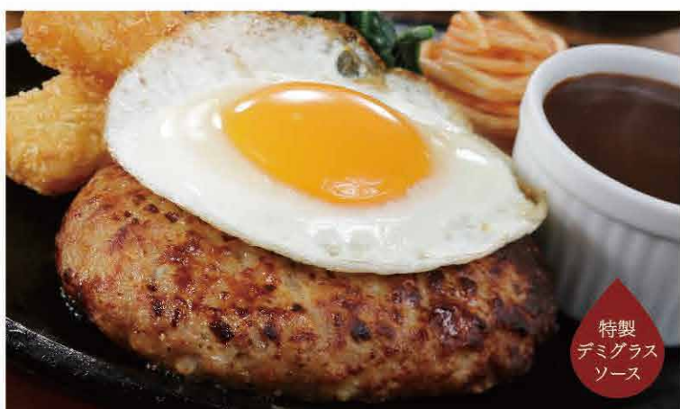
特製 デミグラス ソース