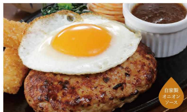
自家製 オニオン ソース