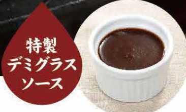
特製 デミグラス ソース