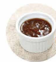
自家製 オニオン ソース