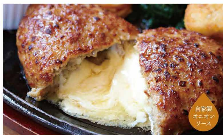
自家製 オニオン ソース