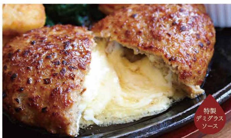
特製 デミグラス ソース